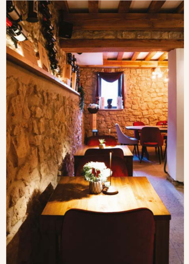
Bistro Wine Bar