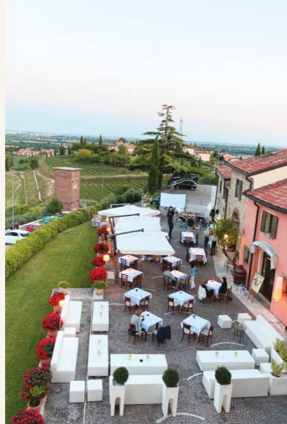
Meeting & Events