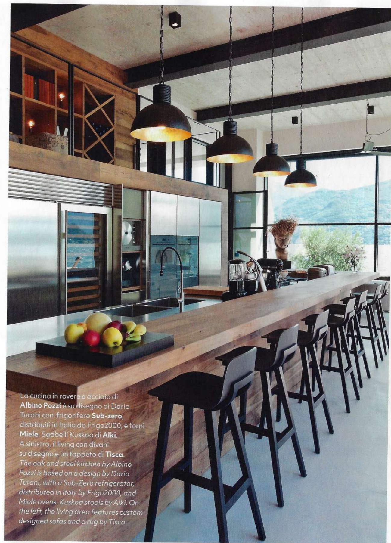
La cucina in rovere e acciaio di Albino Pozzi è su disegno di Dario Turani con frigorifero Sub-zero , distribuiti in Italia da Frigo2000, e forni Miele . Sgabelli Kuskoo di Alki . A sinistra, il living con divani su disegno e un tappeto di Tisca . The oak and steel kitchen by Albino Pozzi is based on a design by Dario Turani, with a Sub-Zero refrigerator, distributed in Italy by Frigo2000, and Miele ovens. Kuskoo stools by Alki. On the left, the living area features custom-designed sofas and a rug by Tisca.