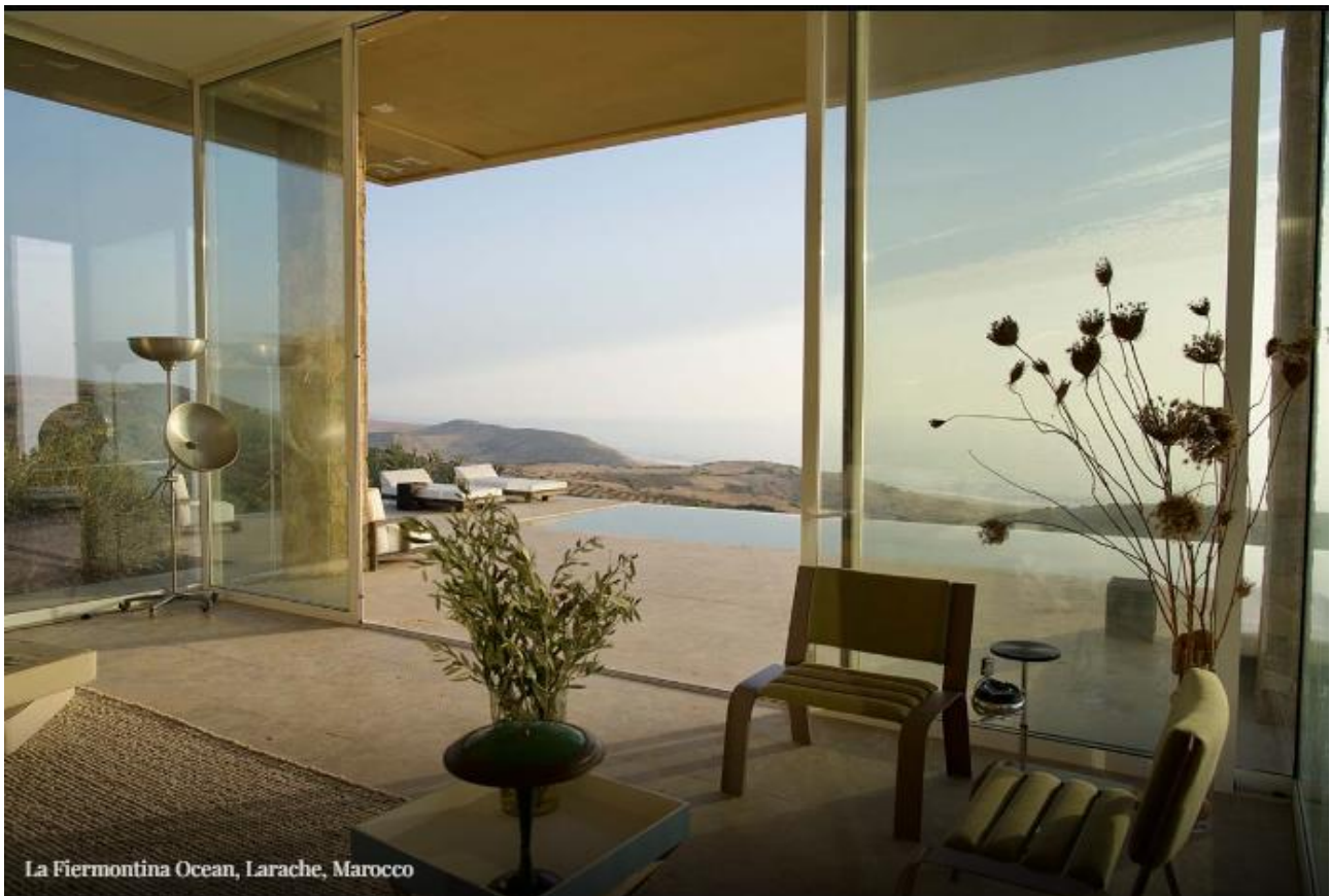
La Fiermontina Ocean, Larache, Marocco