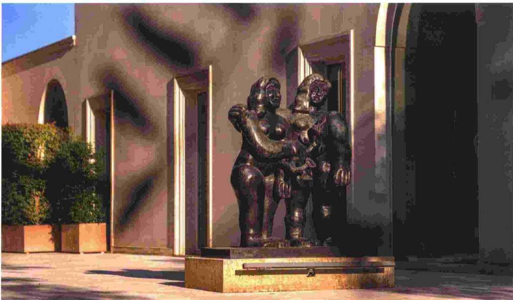
Una scultura di Fernand Léger nel parco della Fiermontina Luxury Home.

con diciannove camere e suite, impreziosite da opere d'arte e un vasto giardino con piscina. A pochi metri, in vico dei Raynò, sorge il nuovo Fiermonte Museum che accoglie opere d'arte della collezione di famiglia e quattro suite dedicate alle arti. La Suite Nocturne è dedicata alla musica e ispirata alla violinista Antonia e al violoncellista