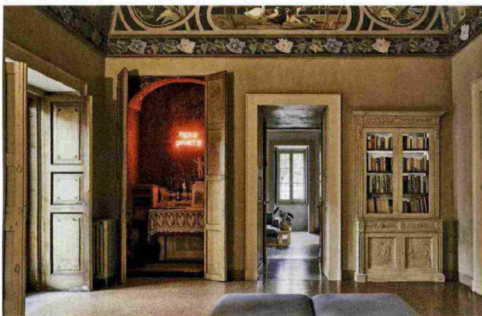
Due ambienti di Palazzo Daniele, ristrutturato dagli architetti Serafini e Palomba.