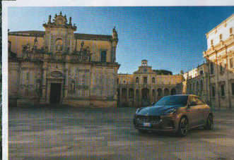
SOPRA, A LECCE CON IL PRIMO SUV MASERATI 100 PER CENTO ELETTRICO COLOR "RAME FOLGORE".