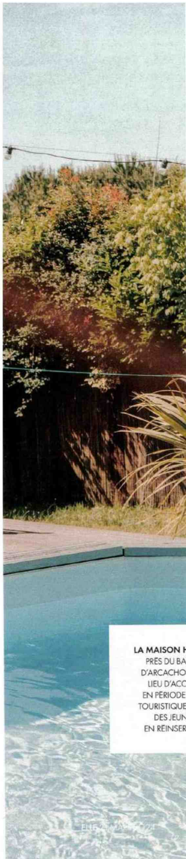
LA MAISON HIWWA, PRÈS DU BASSIN D'ARCACHON. UN LIEU D'ACCUEIL, EN PÉRIODE NON TOURISTIQUE, POUR DES JEUNES EN REINSERTION.