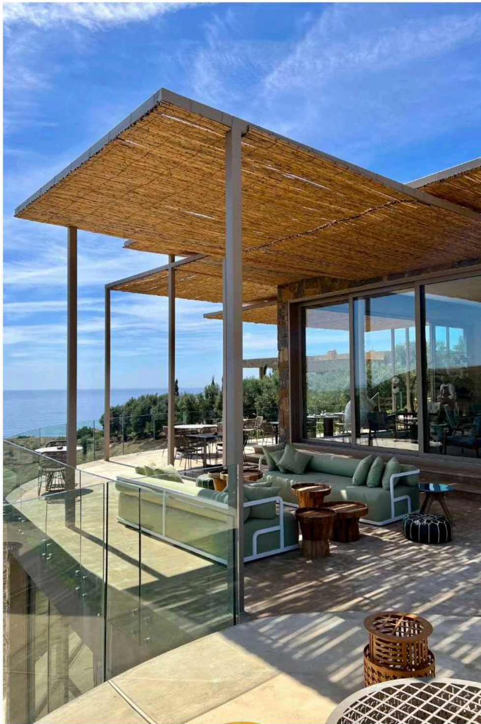
La Fiermontina Ocean

Côté bien-être, le village de Dchier abrite un hammam traditionnel aux 4 rituels : sable du désert, coquelicot, santal d'orient et mandarin aux agrumes. Gommage, soin au gant puis exfoliant, massage relaxant, dynamique ou drainant complètent l'offre du spa qui invite à un retour aux sources.