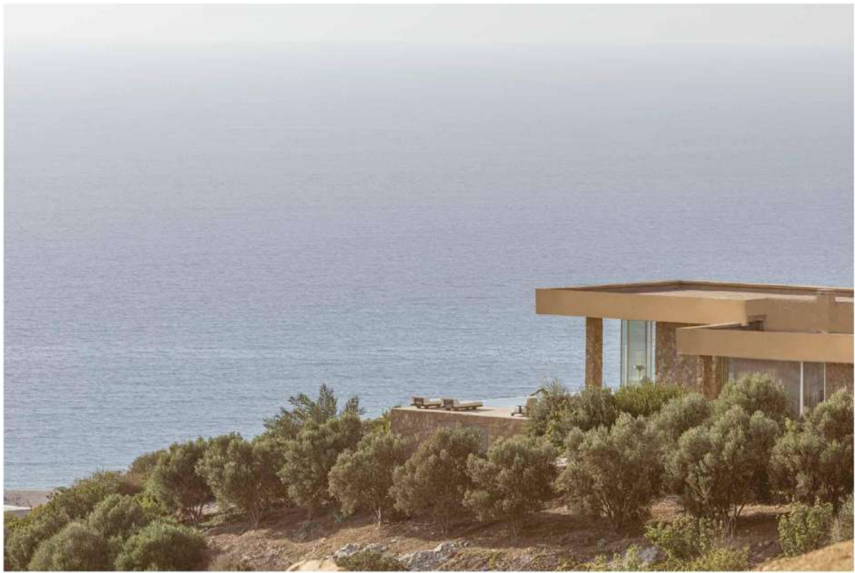
La Fiermontina Ocean

Soutenu par la Fondation Orient-Occident, le projet de construction de l'éco-retraite a contribué depuis juin 2020 à la distribution de l'eau courante et la modernisation de l'école du village. Installée au cœur du projet du Parc Naturel Régional - Les Dunes de Khemis Sahel, La Fiermontina Ocean est ancrée dans le village de Dchier pour encourager son développement et offrir aux hôtes une expérience authentique auprès des habitants. L'hôtel 5 étoiles se dévoile dans une région du Maroc encore méconnue, où chèvres et moutons gambadent dans une nature préservée.