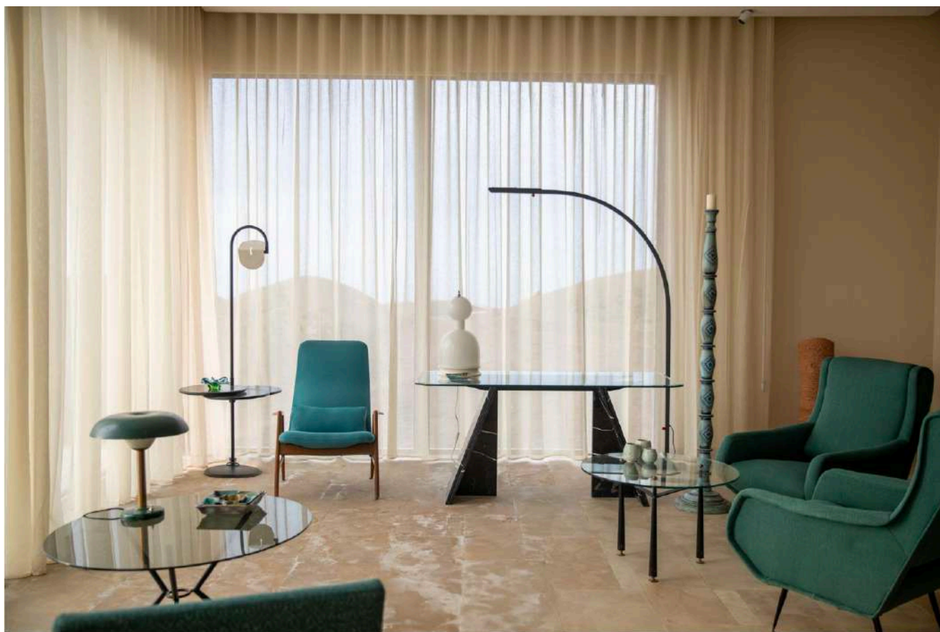
La Fiermontina Ocean

On emprunte un chemin de terre ocre bordé par une forêt de chênes-lièges, de mini-palmiers et des bosquets de fougères qui composent un paysage tout en nuances de vert. L'éco-retraite est construite de manière éclatée et se divise entre des suites et des villas éparpillées sur la côte rocheuse de Larache avec en contrebas, des plages désertes et l'Atlantique à perte de vue. Un style très naturel et design, où les matériaux découpent l'horizon dans un style des années 1970, à mi-chemin entre l'esprit californien et les lignes Art déco. Les deux architectes du studio Laboratoire Design, Charles-Philippe et Christophe, ont construit l'hôtel de manière à ce que la vue sur l'océan soit omniprésente. Pour une expérience en symbiose avec l'environnement et à la dimension méditative, l'éco-retraite accueille ses hôtes dans l'une de ses 11 Suites avec piscines et jardins privés, dans l'une des 2 grandes villas ou encore dans l'une des 4 maisons traditionnelles construites au milieu du village rural de Dchier.