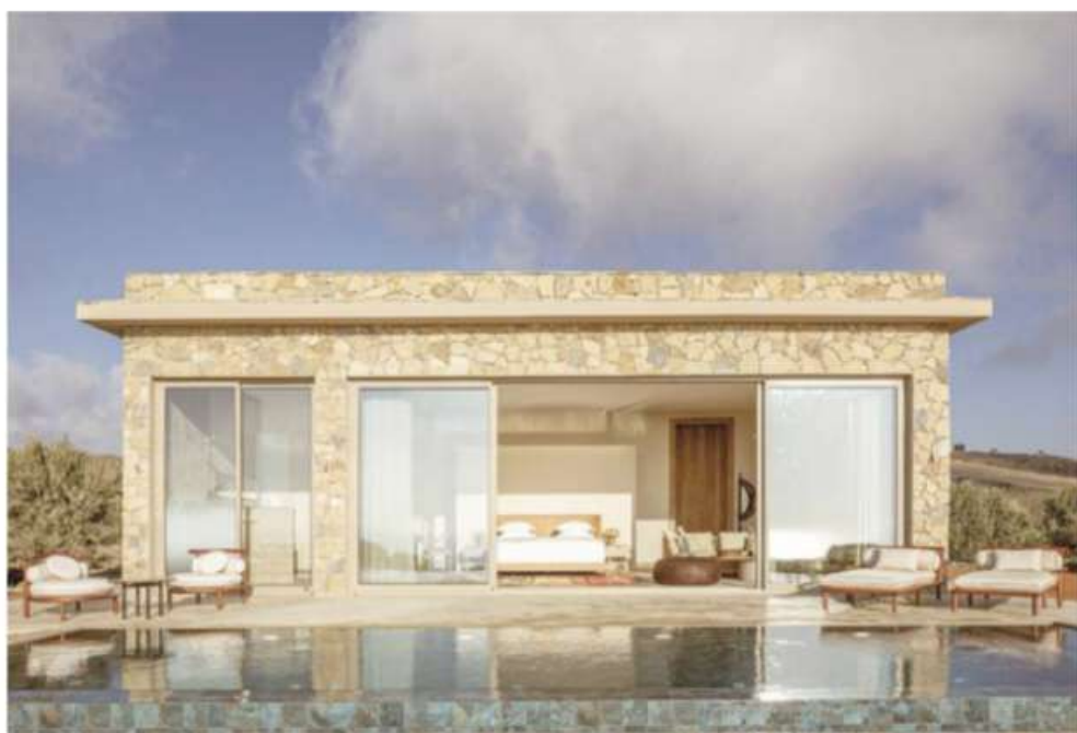
Les villas, face à l'océan, s'agrémentent de piscines, jardinets ou terrasses.

LARACHE Dans cette région oubliée du Maroc, entre plages désertes, villages bleu et blanc et collines d'où pâturent chèvres et moutons, La Fiermontina Ocean , nouveau cinq-étoiles, joue la carte solidaire.