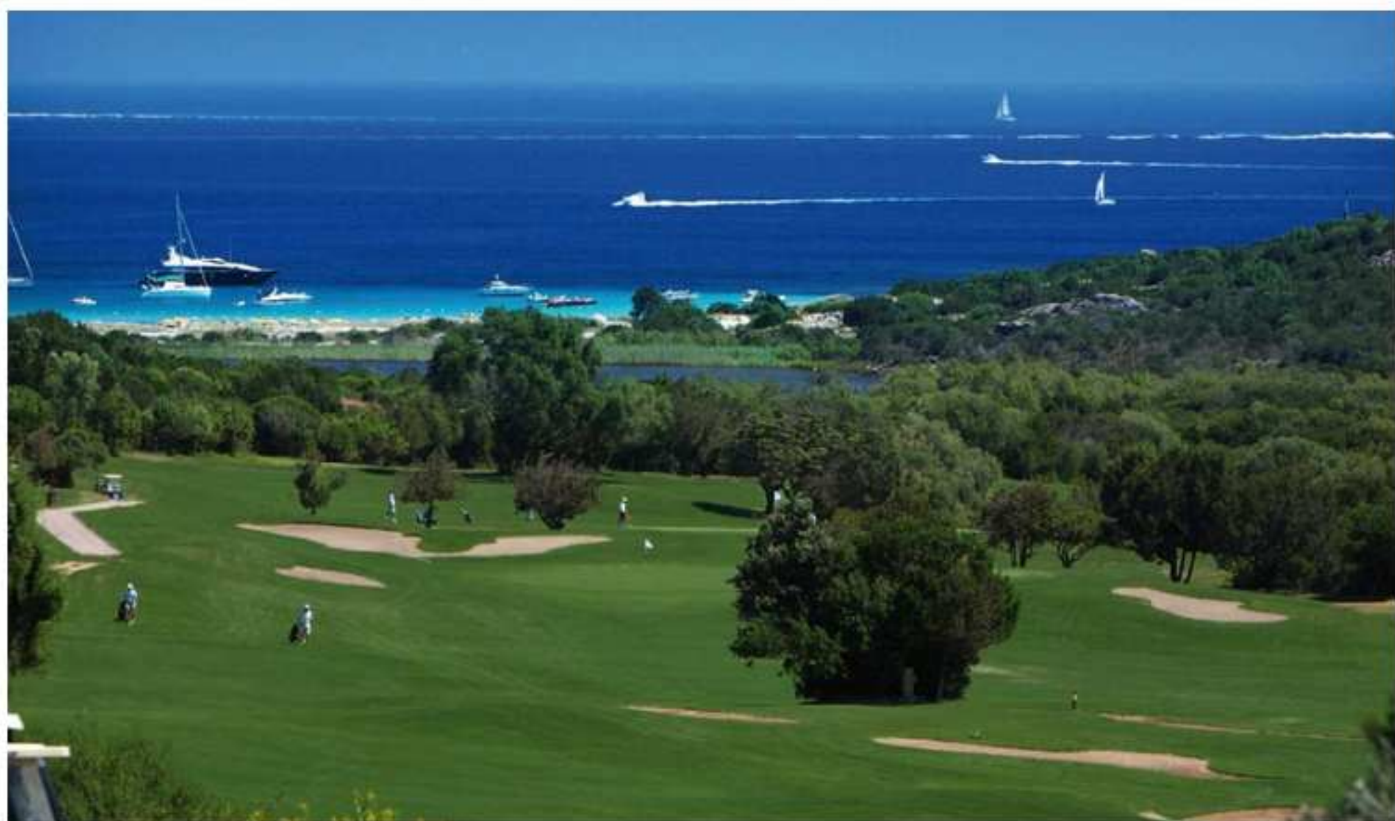
Pevero Golf Club

Incastonato tra i dolci pendii e immerso nella fitta vegetazione della macchia mediterranea, la struttura estremamente nuova e all'avanguardia è una location privilegiata, dedicata a chi ama essere circondato da un'atmosfera unica e raffinata. La location si trova ad appena 250 metri dalle incantevoli e famose spiagge cristalline, a pochi chilometri dal convenzionato Pevero Golf Club (un campo da golf con 18 buche), dalla vibrante e affascinante Porto Cervo e a pochi passi dai locali e dalle discoteche più in voga della Costa Smeralda tra cui il Billionaire Club di Flavio Briatore .