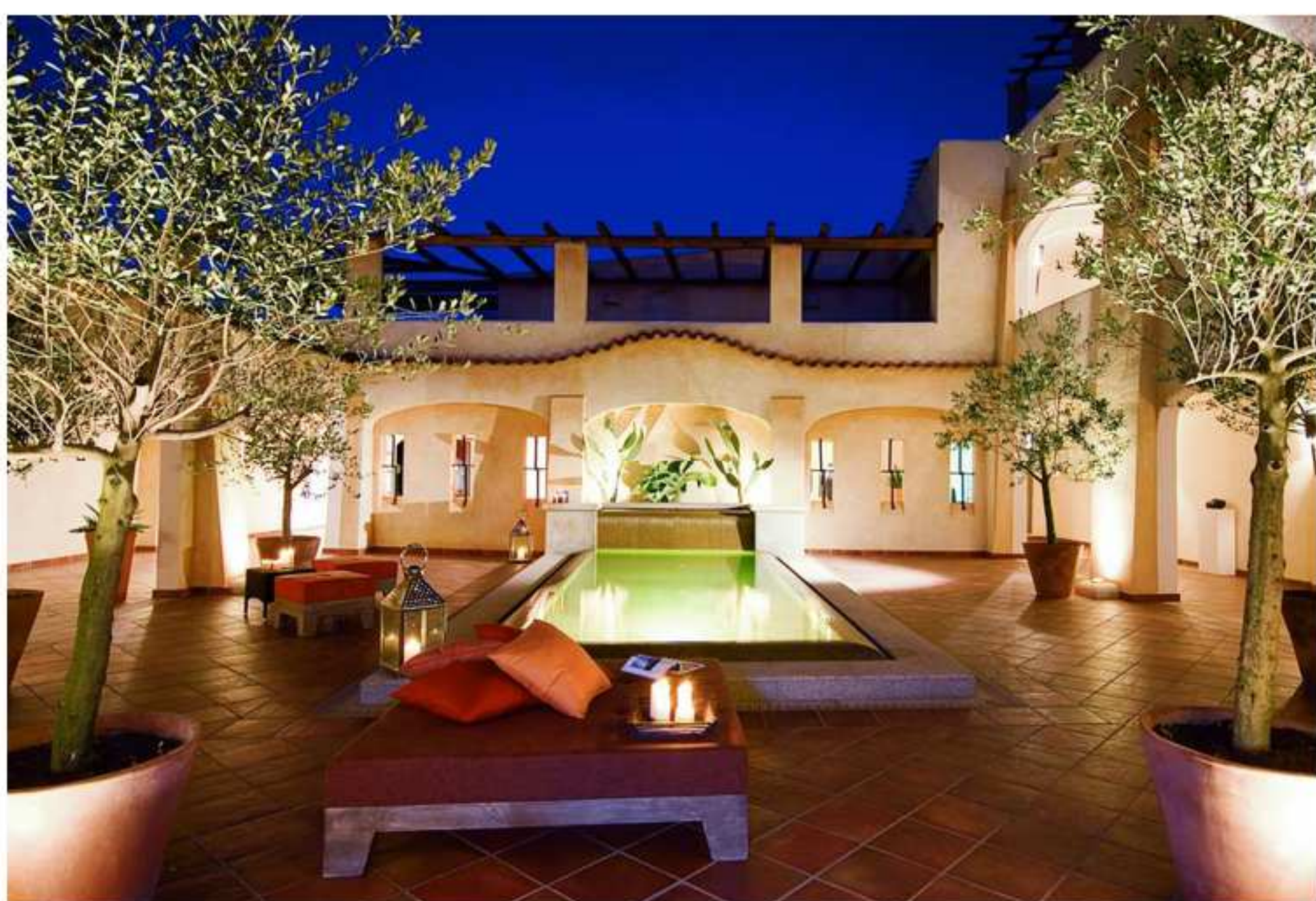
Colonna Pevero Hotel - Area Wellness

In località esclusive come la Costa Smeralda , frequentata da personalità altrettanto esclusive e con alte esigenze, è sottintesa la presenza di strutture che soddisfino questo turismo che possiamo tranquillamente definire di lusso. In questo caso la nostra attenzione va al Colonna Pevero Hotel , un resort five star in località Pevero che, negli ultimi anni, si sta imponendo come valida alternativa a strutture ormai già viste.