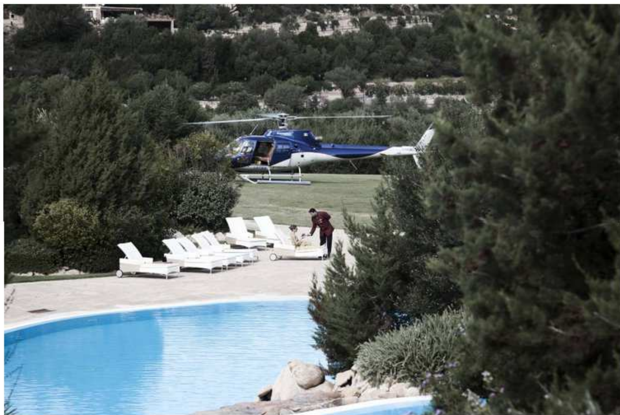
Colonna Pevero Hotel - Atterraggio su elisuperficie

Il Resort dispone di 100 camere esclusive , in perfetta armonia tra stile tradizionale e moderno, tutte con vista panoramica sull'affascinante Golfo del Pevero . L'area solarium e le 5 piscine a sfioro con cascate su vari livelli giocano a nascondersi tra la vegetazione, offrendo agli ospiti riservatezza e relax assoluti. Non mancano un centro benessere e un'area fitness, equipaggiati con gli ultimissimi macchinari Technogym (azienda italiana leader nel settore), oltre ad un percorso salute nel parco privato. I clienti possono gustare i diversi sapori di tre ristoranti , di cui due "à-la-carte" e trascorrere momenti piacevoli presso i tre bar. Chi lo desidera può atterrare direttamente sulla elisuperficie e dirigersi nella Presidential Suite da 160 mq con due camere, una sala da pranzo, un bar e tre bagni oltre a una terrazza da 80 mq con piscina privata.