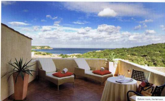
Deluxe room, the terrace.

L'accoglienza è calda e familiare sebbene la struttura abbia 100 camere ed un pubblico italiano ed internazionale molto esigente, di tutte le età e provenienze. Che siano coppie, celebrities o famiglie con bimbi, ciascuno è seguito con estrema cura dallo staff gentile e proattivo. E soprattutto ciascuno può godere di grande privacy e serenità.