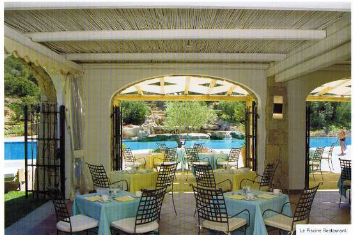
Le Piscine Restaurant.

This is truly the Sardinia that everyone loves, not just the sea and lush nature but also excellent traditions and a passionate and innovative sense of entrepreneurship.