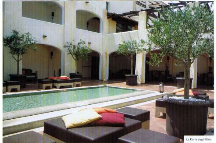
La Cortile degli Ulivi.