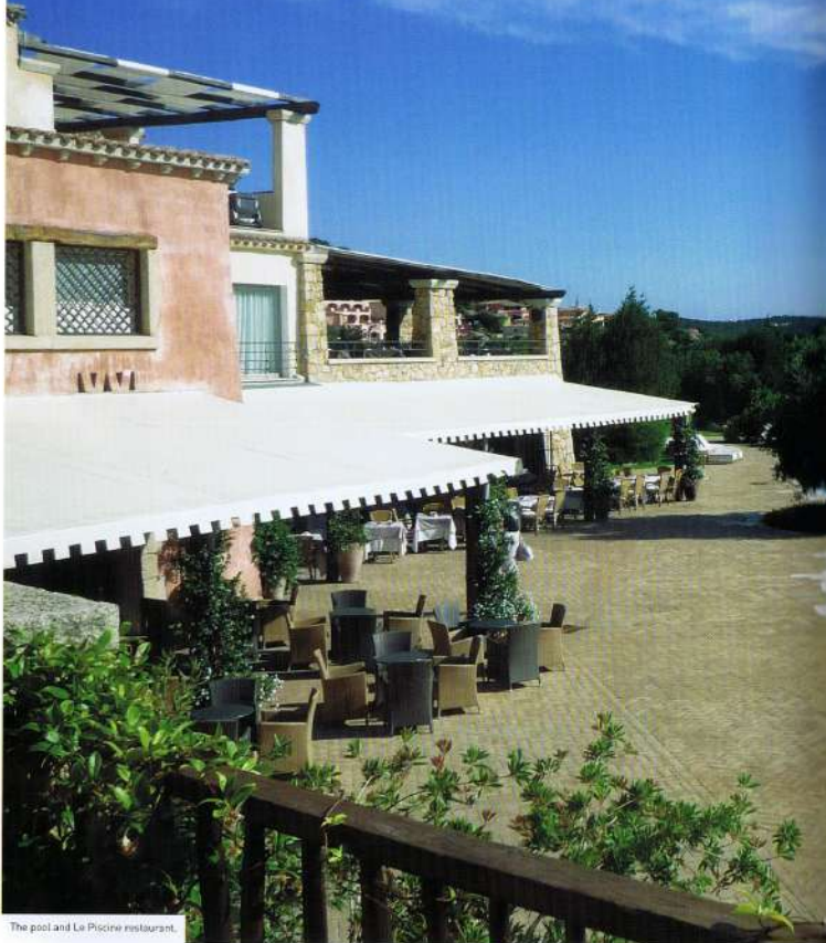
The pool and Le Piccione restaurant.