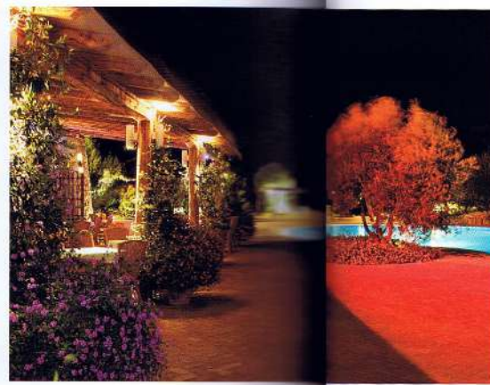
Colonna Pevero Hotel, Sardinia, Italy.

piscina e uno affacciato su cascate illuminate, tre bar, cinque piscine, eliporto privato e parcheggi autonomi, centro fitness e centro Wellness&Beauty. Quest'ultimo da sfruttare al massimo per ritempersi dopo le fatiche della preparazione al giorno del sì: un ambiente rilassante che permette di riconciliare anima e corpo, lasciandosi coccolare da massaggi e trattamenti estetici che trasformano le giornate in Sardegna in un'esperienza di assoluto benessere. Che da quest'anno si completa con l'attenzione al biologico, con menu dedicati a chi segue una dieta vegetariana, e con il servizio "tailor-made", per personalizzare al massimo il proprio soggiorno, che sia una semplice vacanza o un fantastico viaggio di nozze.