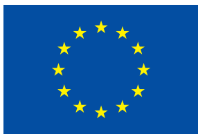
UNIONE EUROPEA Fondo Europeo di Sviluppo Regionale