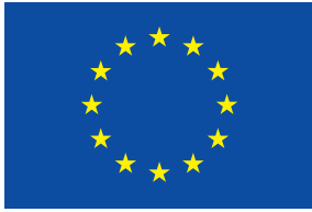
UNIONE EUROPEA Fondo Europeo di Sviluppo Regionale