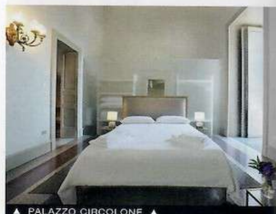
▲ PALAZZO CIRCOLONE ▲