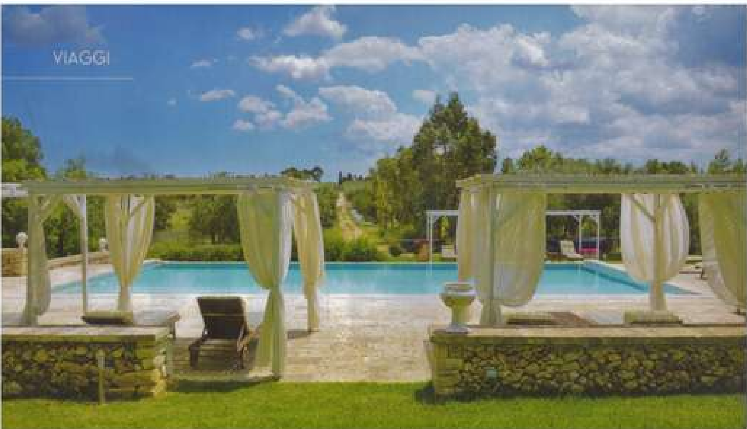
La piscina del Naturalis Bio Resort & Spa, di acqua trattata con sale marino.