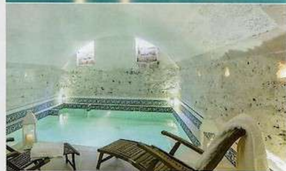
La due piscine di Palazzo Ducale Venturi.