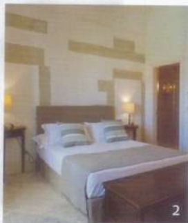
1. La piscina esterna salina. 2. Camera Deluxe. 3. Il giardino.

• Palazzo Ducale Venturi Luxury Relais & Wellness , tel. 0836.818717, palazzoducaleventuri.com