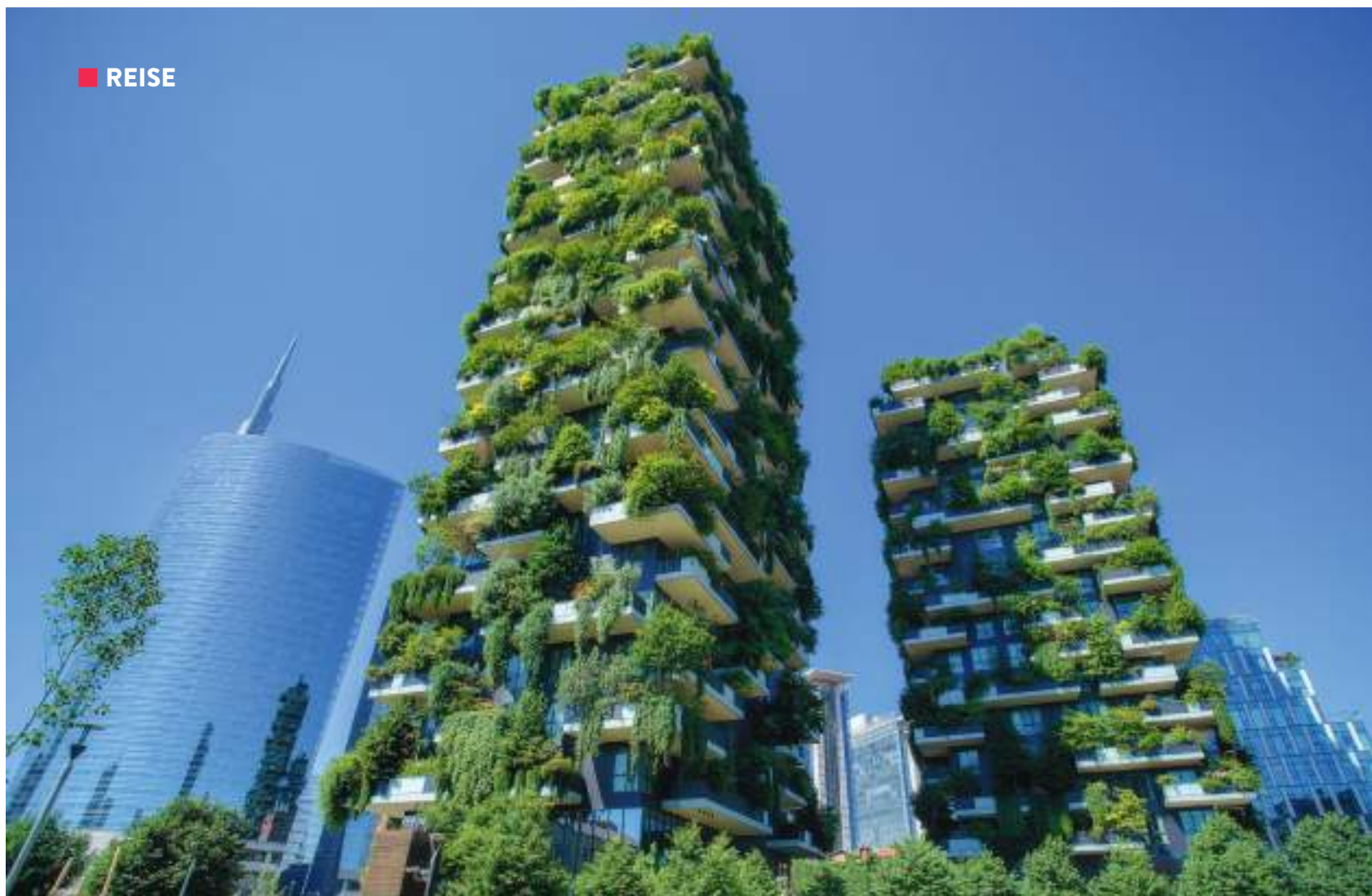
BOSCO VERTICALE: Den vertikale skogen er bokstavelig talt to grønne lunger i storbyen. Bygningene huser 800 trær, 4500 busker og 20 000 planter, over 100 ulike arter, og er et imponerende skue.

trikkene ned til sentrum, eller hopp på metroen hvis du har dårlig tid. Buss, trikk og metro deler samme billett, så velg det fremkomstmiddelet som passer deg best.