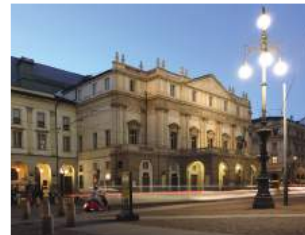
LA SCALA: Det legendariske operahuset åpnet dørene i 1778, og er verdt et besøk.

Men det er ikke bare Armani som er verdt å se i Pinacoteca di Brera. Akkurat nå kan man også se restaureringen av Peter Paul Rubens verk «Nattverden» fra ca. 1632, mens du i Santa Maria delle Grazie kan se Leonardo da Vincis «Nattverden», som forestiller Jesu siste måltid slik det beskrives i Bibelen.