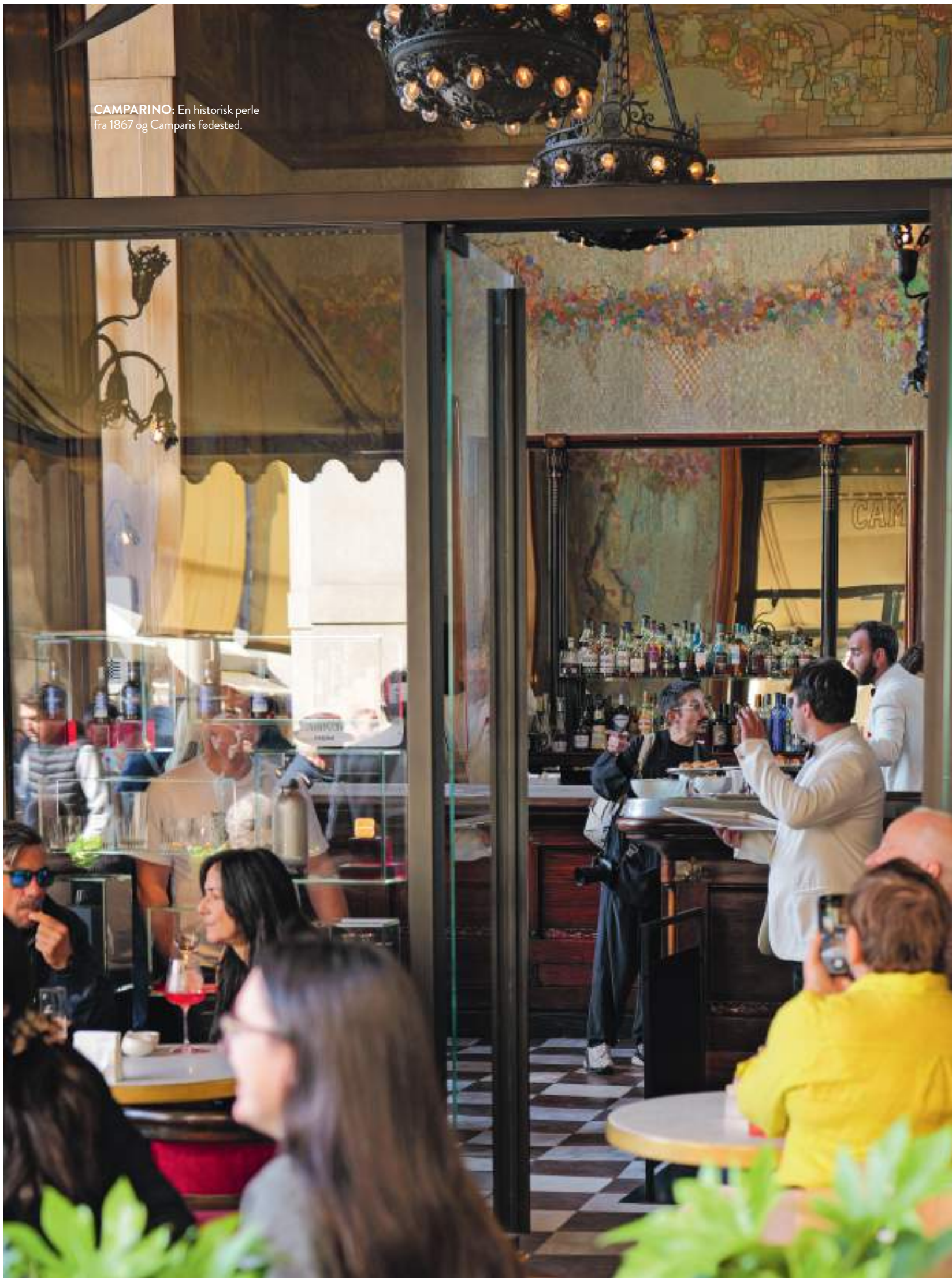
CAMPARINO: En historisk perle fra 1867 og Camparis fødested.