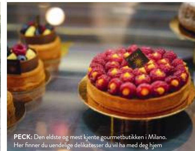
PECK: Den eldste og mest kjente gourmetbutikken i Milano. Her finner du uendelige delikatesser du vil ha med deg hjem