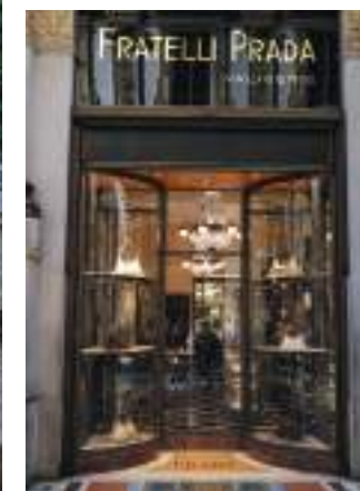
PRADA: Mario Pradas første butikk fra 1913, i Galleria Vittorio Emanuele.