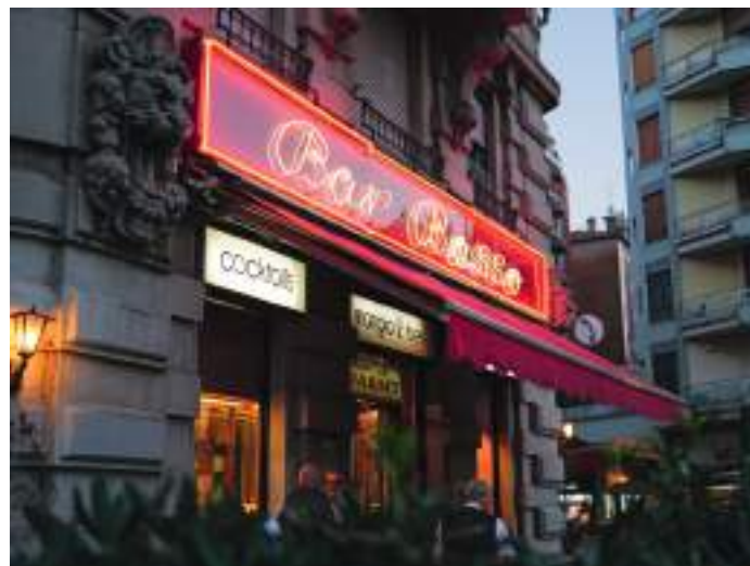
BAR BASSO: I denne baren ble drinken negroni sbagliato født, da eieren brukte prosecco i stedet for gin. Kjent som stedet der aperitivo-kulturen ble til.

grillde grønnsaker er et must etter klokken 13, og Gelateria Oasi har nydelig gelato. Mondeghili, de klassiske milanesiske kjøttbollene, og ossobuco med gremolata og risotto alla milanese er også blant favorittene mine.