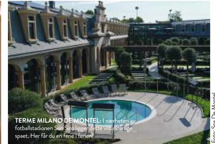
TERME MILANO DE MONTEL: I nærheten av fotballstadionen San Siro ligger dette vidunderlige spaet. Her får du en ferie i ferien!