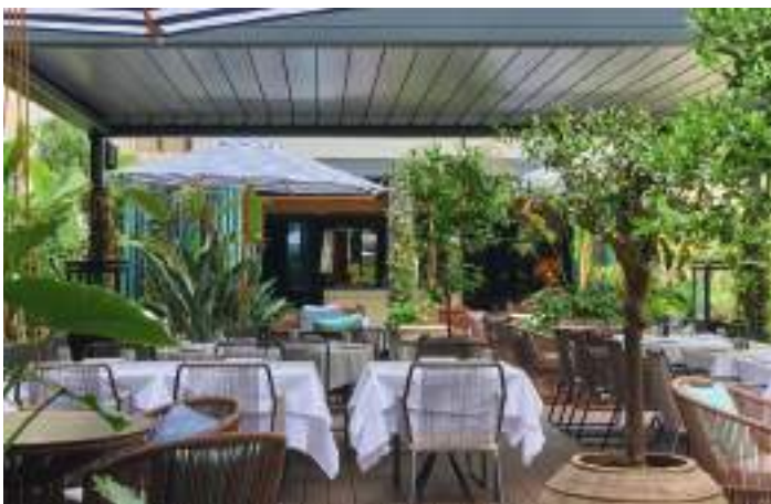
NEMI HOTEL: Lekkert fem stjerners luksushotell, kun 15 minutter å spasere fra sentrum.