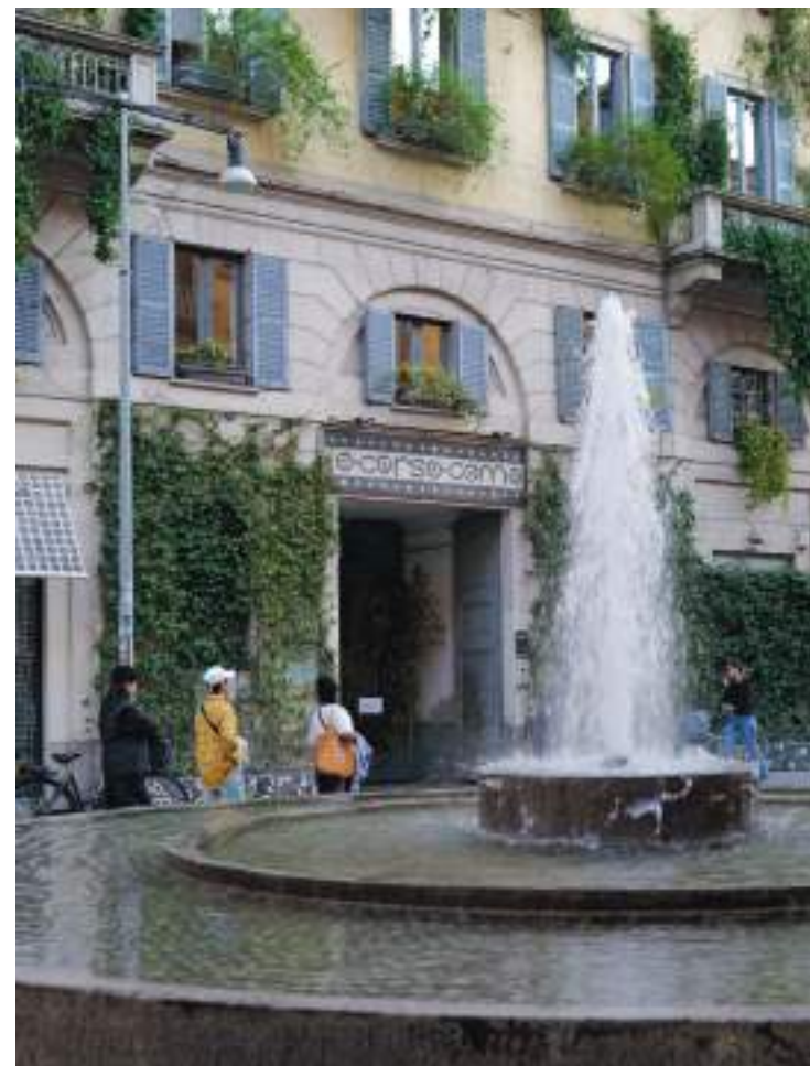
CORSO COMO: Den mest trendy gågaten i Milano er et must å besøke på både dagtid og kveldstid.

Det er ute på byen det skjer. En fylt cornetto og en deilig capuccino på en lokal kafé gjør dagen akkurat litt mer spennende. Det er da du ser livet på gaten. Det opereres med tre priser på kafeer og barer. Står du ved disken, betaler du minst. Sitter