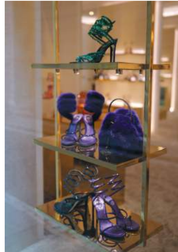
MOTEMEKKKA: I Milano finner du alt hva hjertet kan begjære av designermote, både fra italienske og internasjonale designere. Vintagebutikker med gamle godbiter er også et must å besøke om du er ute etter klassikere.