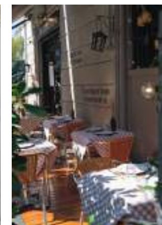
ANTICA TRATTORIA DELLA PESA: En av Milanos eldste restauranter, med tradisjonelle milanesiske retter.

du ved bord innendørs, betaler du litt mer, og sitter du ute, koster det mest. Det er uansett ikke snakk om ruin, så sitt der du ønsker å sitte.