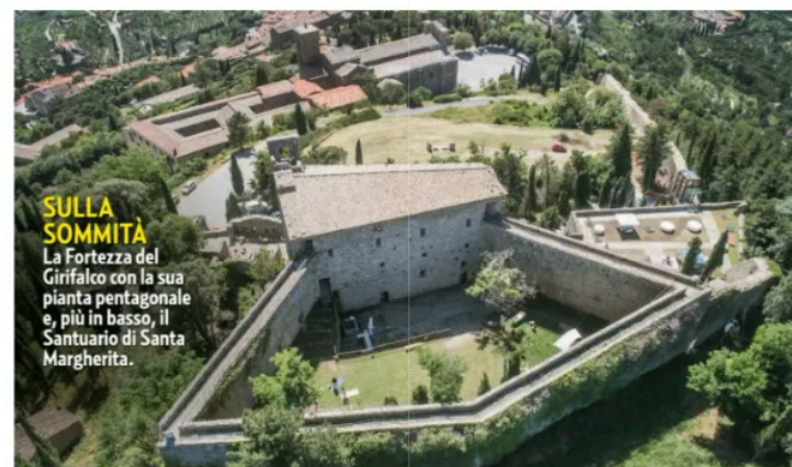
SULLA SOMMITÀ La Fortezza del Girifalco con la sua pianta pentagonale e, più in basso, il Santuario di Santa Margherita.

sileni, sirene, delfini e scene di lotta tra animali o, della metà del Settecento, il raffinato Tempietto Ginori in fine porcellana. Cortona è anche la città di Gino Severini , pittore e critico d'arte vissuto tra il 1885 e il 1966: la sua Maternità (al Maec) e i mosaici