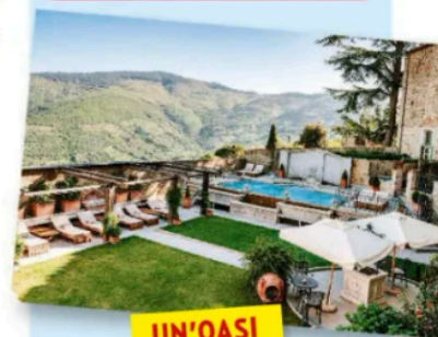
UN'OASI DI QUIETE

sulla piazza omonima. Prima di lasciare il centro per i dintorni va visitata la Chiesa di San Francesco dove una teca in vetro accoglie la tunica del Poverello di Assisi, il cuscino e il reliquiario della Santa Croce. Per respirare la medesima atmosfera recatevi all'Eremo Le Celle. La fitta vegetazione, un torrente solcato da due ponticelli (quello più in basso è detto "del Granduca" e risale al 1728) e un serafico silenzio sono parte dell'incanto. Qui, nel 1211, arrivò San Francesco e qui celebrò la Santa Pasqua del 1215, per poi tornarvi, malato, nella primavera del 1226 e da qui ripartì morente per la sua Assisi. Se gli scorci del paesaggio sembrano belli come scatti d'autore programmate di tornare in paese tra il 16 luglio e l'1 novembre, quando sarà in calendario Cortona On The Move , festival internazionale di fotografia il cui tema è Beautiful Country . Perché la bellezza da queste parti è indiscussa protagonista.