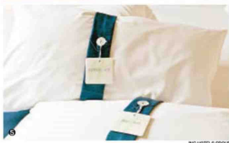
1. Sono numerosi gli hotel che offrono un'esperienza dedicata a migliorare la qualità del sonno; 2. La tisana distensiva servita in camera; 3. Fusilli cotti in brodo di camomilla dello chef Stefano Sforza; 4. La stanza 403 del Turin Palace Hotel a Torino pensata per conciliare il riposo; 5. Il menu di cuscini a disposizione degli ospiti degli Inc Hotels.