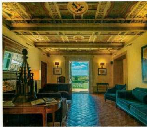
VILLE&amp;CASALI - 127