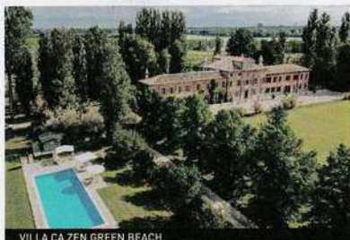
VILLA CA ZEN GREEN BEACH