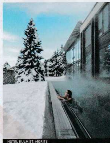
HOTEL KULM ST. MORITZ