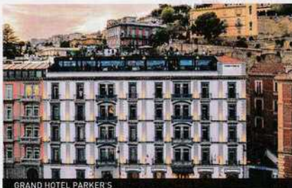
GRAND HOTEL PARKER'S