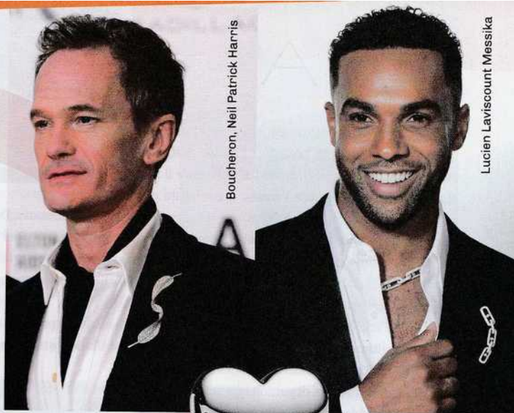
Boucheron, Neil Patrick Harris

I gemelli, protagonisti del look più formale, si fanno spiritosi grazie a Villa Milano , la gioielleria fondata nel 1876: ce ne sono a forma di frutti, animali, auto. Perfetti con qualunque outfit maschile i bracciali Move Cord di Messika sono una combinazione di cordoncino colorato e oro. Ed è unisex il ciondolo di Pandora a forma di cuore da personalizzare con una incisione. Altro gioiello diventato unisex è la spilla, come il modello vintage Foglie di Boucheron , in platino e diamanti, indossata dall'attore Neil Patrick Harris sul bavero della giacca. O la Groove in oro e diamanti di Messika sfoggiata da Lucien Laviscount , protagonista di "Emily in Paris". A proposito della serie di Netflix , nella quarta stagione i protagonisti esplorano lo storico flagship di Boucheron, in Place Vendôme. Le scene sono state girate nell'appartamento sopra la boutique che è prenotabile per pranzi privati o brevi soggiorni. Per poter così scegliere con calma il prossimo dono.