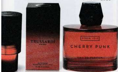
Cherry Punk di Room 1015