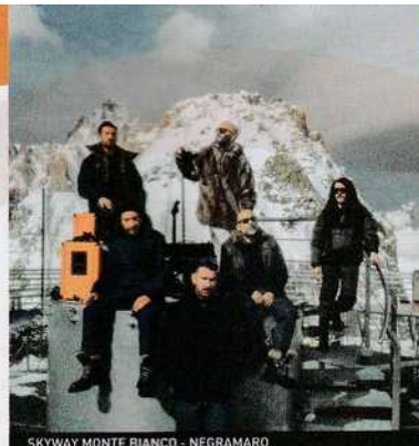
SKYWAY MONTE BIANCO - NEGRAMARO