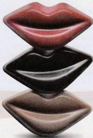
Ciocolips Cioccolato Gourmet

"Diamonds are a girl's best friend", cantava Marilyn Monroe . Versione gourmand (e più economica) sono i Diamanti, i cioccolatini di Cioccolato Gourmet sfaccettati come la gemma. Volutuosi come baci appassionati, sono i Ciocolips a forma di labbra. Con un ripieno sorprendente, confermano che in amore è impossibile fermarsi al primo bacio.