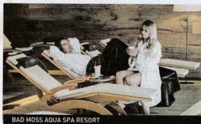
BAD MOSS AQUA SPA RESORT

privata con stuzzichini e vino. Alla Spa Hideaway Cape of Senses da provare il "Lusso della candela" durante un soggiorno su questa terrazza naturale a picco sul Lago di Garda . Ed è ampia la scelta di trattamenti di coppia al 5 stelle Ara Maris sul mare di Sorrento , meta romantica per antonomasia.