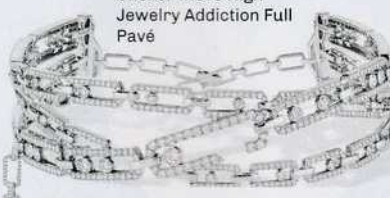
Messika Joaillerie Choker Move High Jewelry Addiction Full Pavé