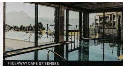
HIDEAWAY CAPE OF SENSES