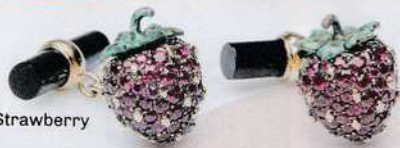
Villa, Gemelli Strawberry