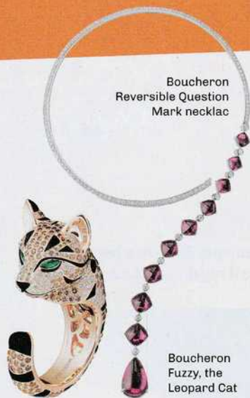
Boucheron Reversible Question Mark necklac