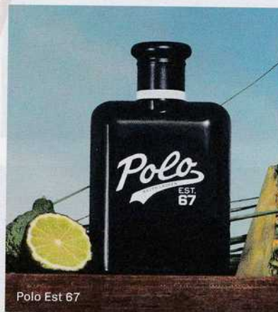
Polo Est 67