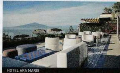
HOTEL ARA MARIS

privata con stuzzichini e vino. Alla Spa Hideaway Cape of Senses da provare il "Lusso della candela" durante un soggiorno su questa terrazza naturale a picco sul Lago di Garda . Ed è ampia la scelta di trattamenti di coppia al 5 stelle Ara Maris sul mare di Sorrento , meta romantica per antonomasia.