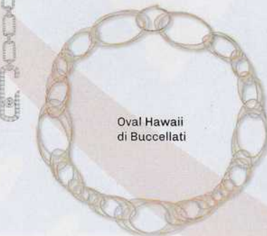
Oval Hawaii di Buccellati