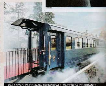
PALAZZO DI VARIGNANA TRENOREALE CARROZZA RISTORANTE