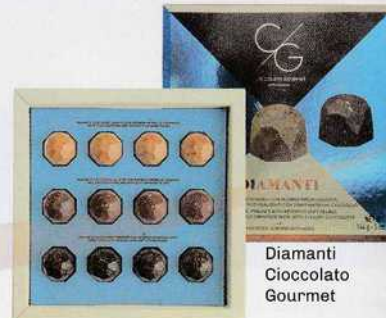
Diamanti Cioccolato Gourmet