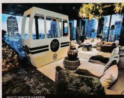
HYATT WINTER GARDEN